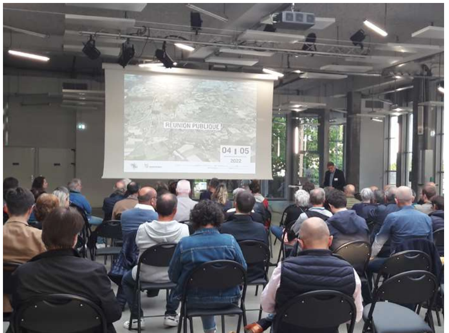
Réunion publique : présentation du diagnostic réalisé dans le cadre de l'étude urbaine _ 4 mai 2022