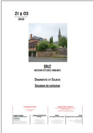
^ Diagnostic et enjeux (mars 2022)