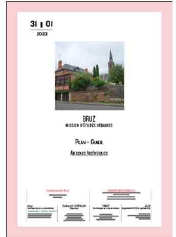
^ Plan-Guide / Annexes techniques (janvier 2023) non communicables