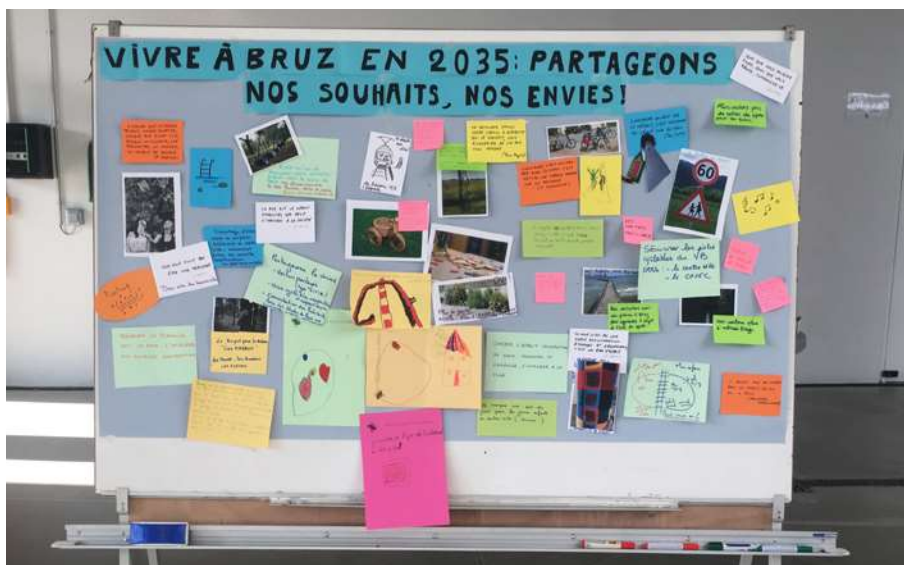
Fresque participative réalisée dans le cadre de la journée de concertation publique _ 4 mai 2022