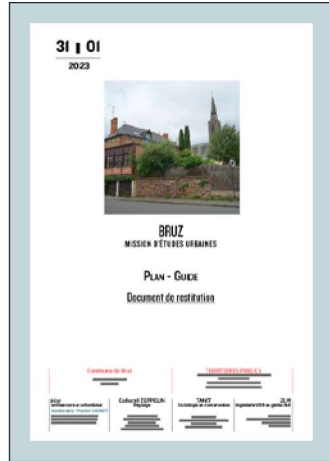
^ Plan-Guide / Document de restitution (janvier 2023)